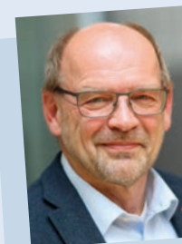
Rainer Schmeltzer, 1. Vizepräsident des Landtags

Erwerb des Fachlehrerdiploms Pädagogik. Dozent am Studieninstitut für kommunale Verwaltung und bis 2012 Hauptamtlicher Bürgermeister der Stadt Rietberg, verheiratet, zwei Kinder. Seit 2017 Präsident des Landtags Nordrhein-Westfalen (erneute Wahl am 1. Juni 2022).