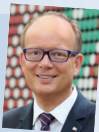
André Kuper, Präsident des Landtags Nordrhein-Westfalen

Geboren 1960 in Wiedenbrück, Studium der Verwaltungswissenschaften und Studium der Wirtschaftswissenschaften sowie