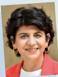
Berivan Aymaz, 2. Vizepräsidentin des Landtags

Geboren 1961 in Lünen, Wohnungsfachwirt und Gewerkschaftssekretär der Gewerkschaft ÖTV, verheiratet, ein Kind. 2015 bis 2017 Minister für Arbeit, Integration und Soziales des Landes Nordrhein-Westfalen, seit 2000 Abgeordneter des Landtags, am 1. Juni 2022 Wahl zum 1. Vizepräsidenten des Landtags.