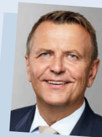
Christof Rasche, 3. Vizepräsident des Landtags

verschiedenen Menschenrechts- und Migrantenorganisationen. Seit 2017 Mitglied des Landtags, am 1. Juni 2022 Wahl zur 2. Vizepräsidentin des Landtags.